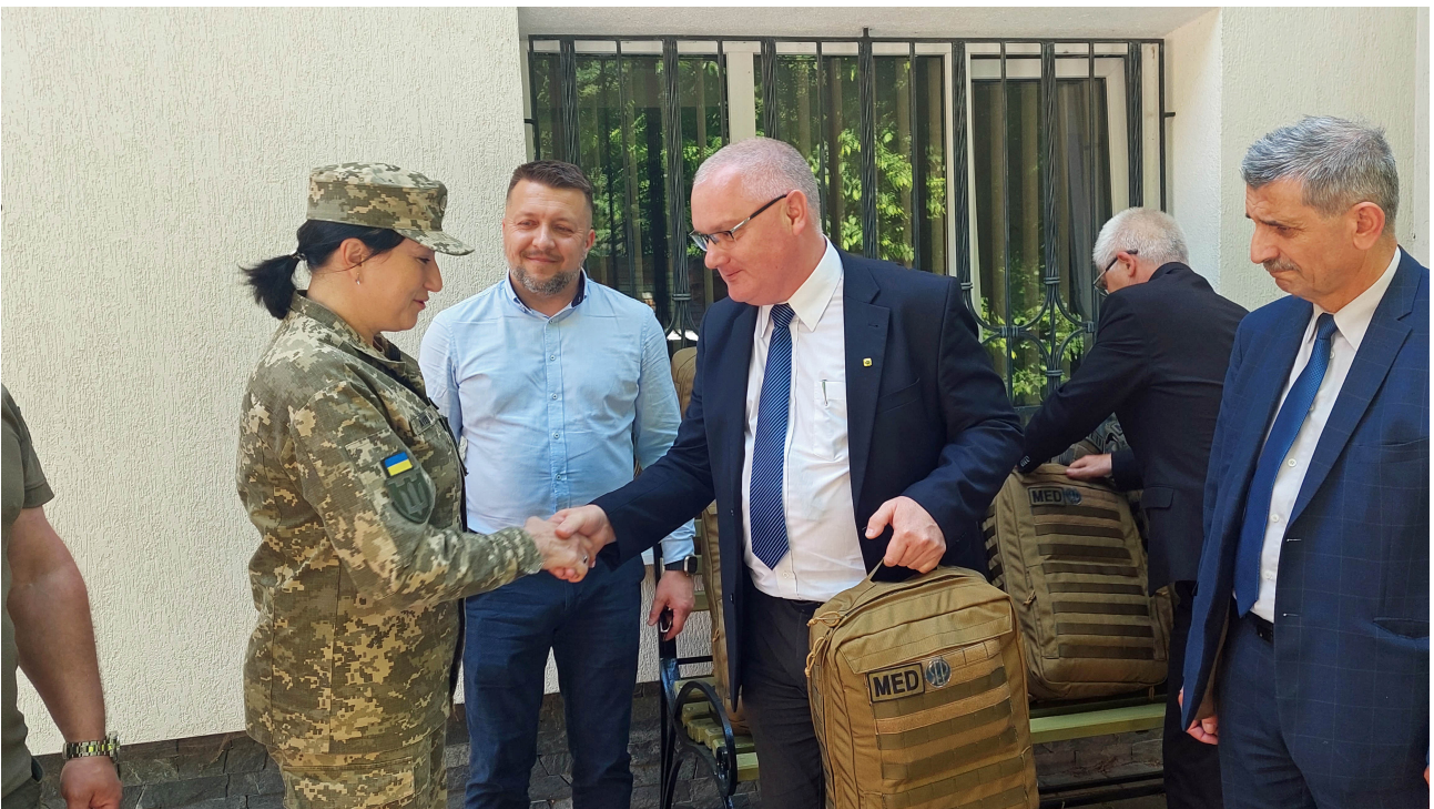
Plecaki z rąk Prezesa SEP odbierają przedstawiciele Sił Zbrojnych Ukrainy