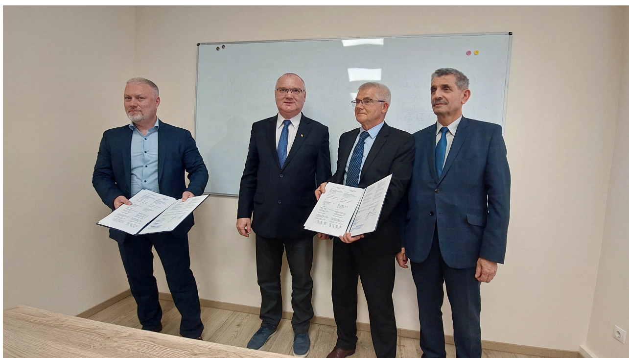
Sygnatariusze prezentuj podpisane porozumienie...