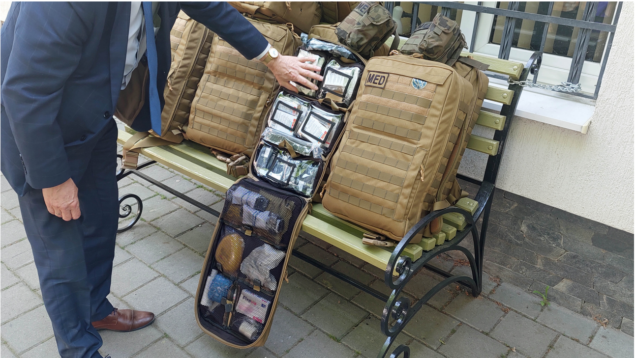
Wnętrze jednego z plecaków ratunkowych. Wyposażenie tej "superapteczki" zgodne jest ze standardami wojsk NATO