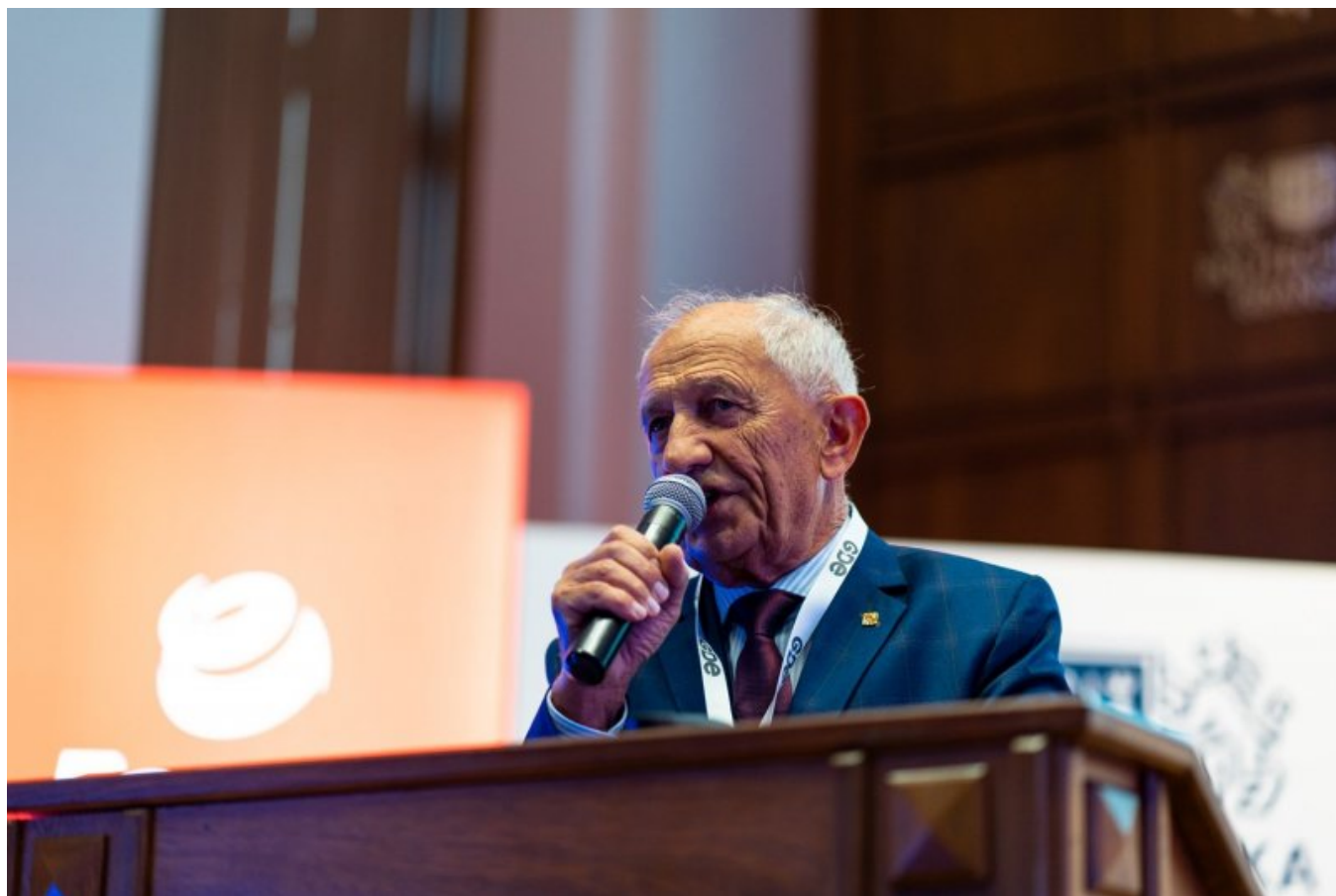
Prezes Oddziału Gdańsk SEP otwierający GDE