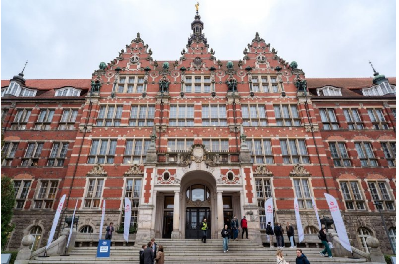
Gmach Główny Politechniki Gdańskiej