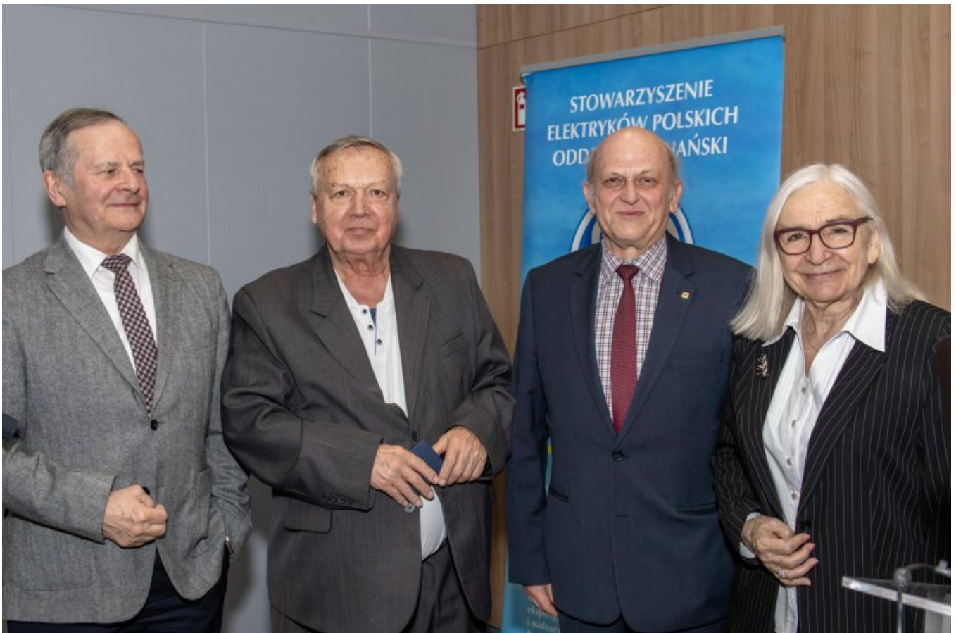
Odznaczeni Szafirową Odznaką Honorową SEP