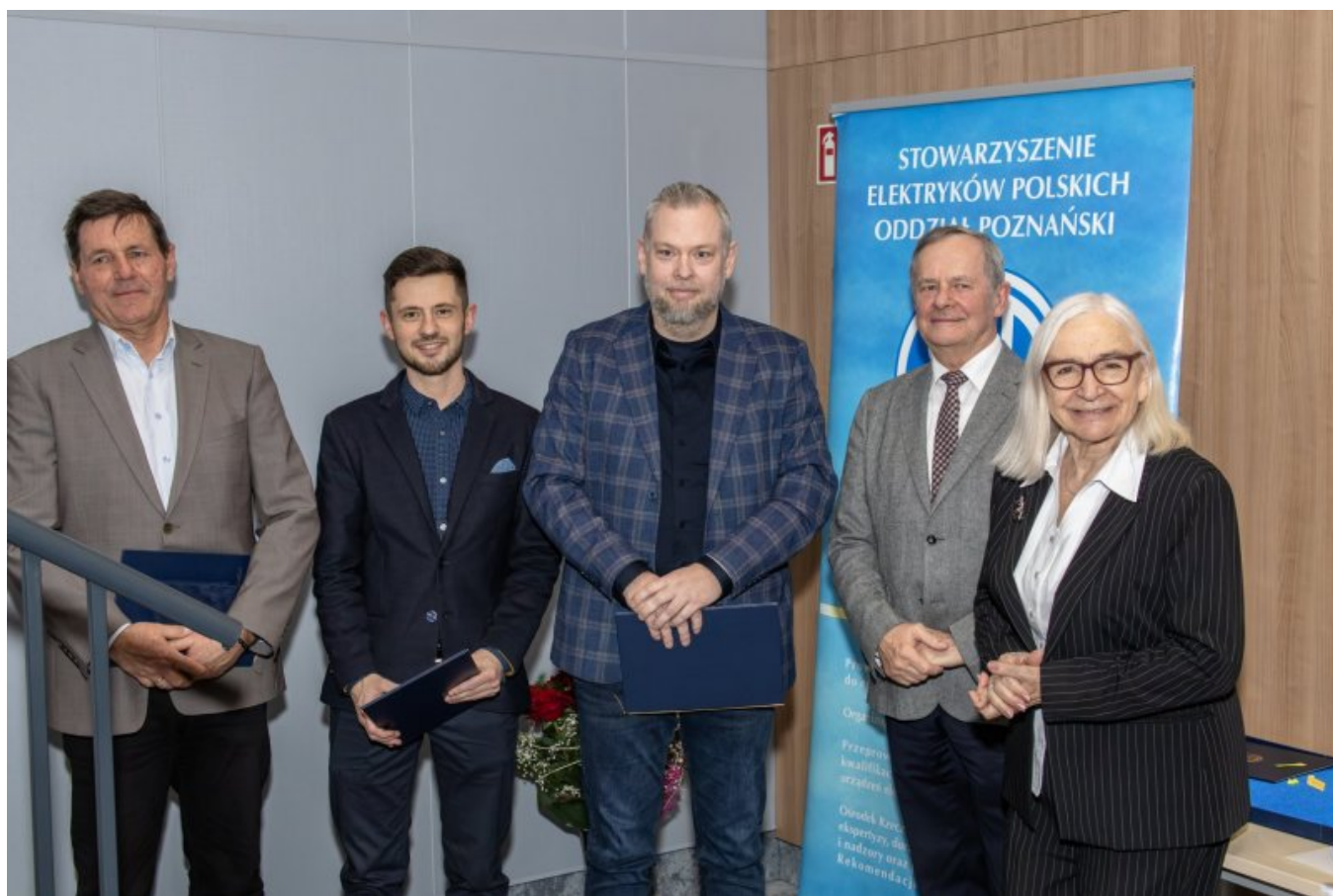
Wyróżnieni Medalem im. prof. Józefa Węglarza