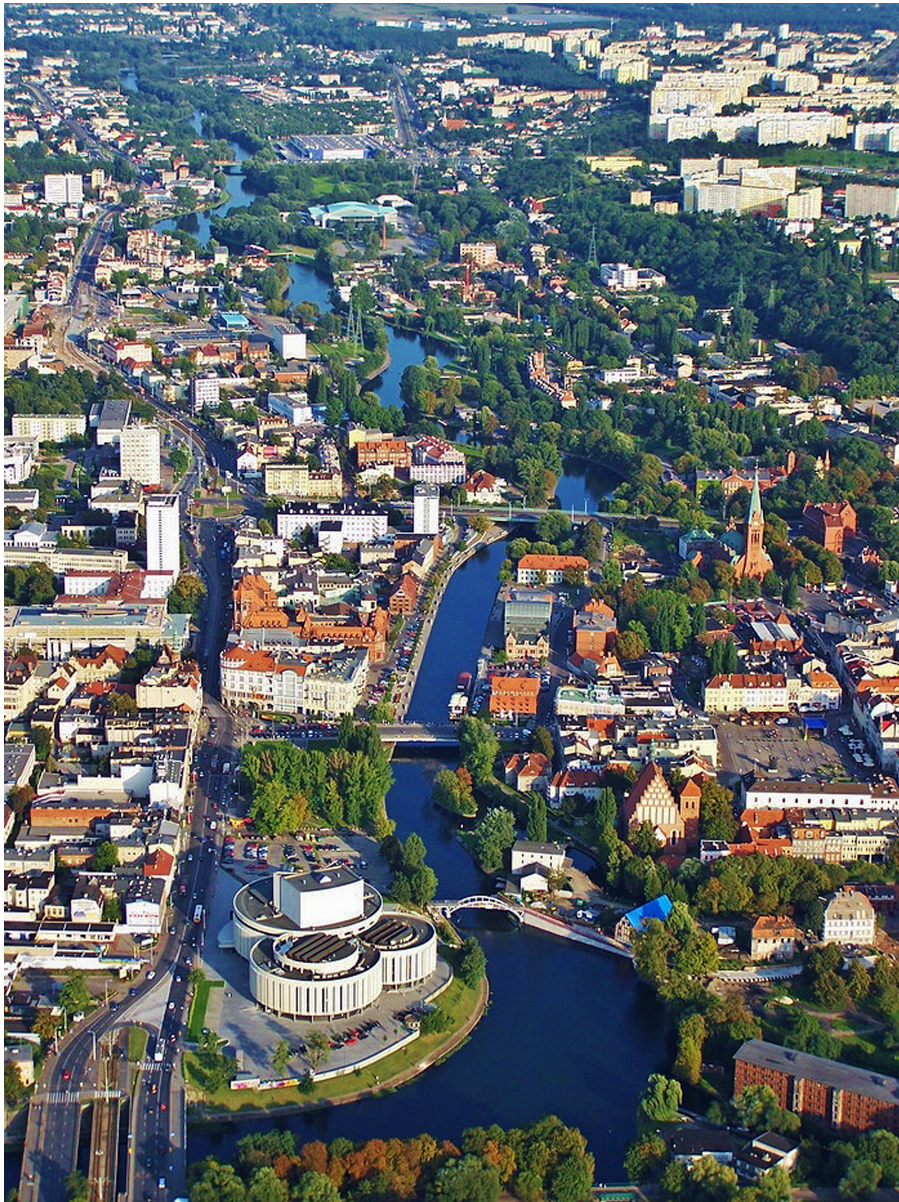
Centrum Bydgoszczy z lotu ptaka

Logowanie do strony dla Delegatów Link do materiałów dla Mediów