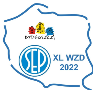
Logo XL Walnego Zjazdu Delegatów Stowarzyszenia Elektryków Polskich

Logo, jako pewien wyraz artystyczny, powinno pobudzać wyobraźnię i odczucia artystyczne każdego odbiorcy indywidualnie, dlatego ograniczę się jedynie do zwrócenia uwagi na trzy elementy. Kontur Polski symbolizuje ogólnopolski charakter działalności Stowarzyszenia Elektryków Polskich. Logo SEP jednoznacznie określa o jakie Stowarzyszenie chodzi. Logo miasta Bydgoszczy, umieszczone w geograficznym odniesieniu do konturu Polski, wskazuje na gospodarza XL Walnego Zjazdu Delegatów SEP.