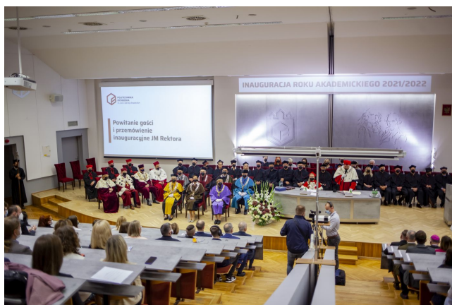
Widok wnętrza Auditorium Novum Politechniki Bydgoskiej podczas inauguracji roku akademickiego 2021/22

Obrady będą odbywały się w Auditorium Novum Politechniki Bydgoskiej , al. prof. Sylwestra Kaliskiego 7, 85-796 Bydgoszcz. Jest to nowoczesny obiekt o powierzchni netto 2503 m 2 i kubaturze 14586 m 3 z główną salą audytoryjną na 500 miejsc, którą za pomocą mobilnej ściany akustycznej można dzielić na dwie mniejsze sale po 250 miejsc każda. Oprócz głównej sali, kompleks funkcjonalnie uzupełniają cztery sale wykładowe przeznaczone łącznie dla 240 osób oraz pomieszczenia socjalne, magazynowe i techniczne.