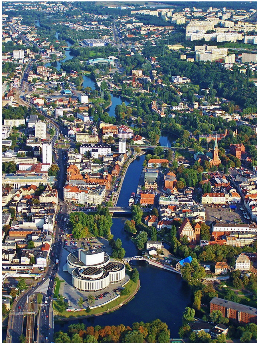
Centrum Bydgoszczy z lotu ptaka

Logowanie do strony dla Delegatów Link do materiałów dla Mediów