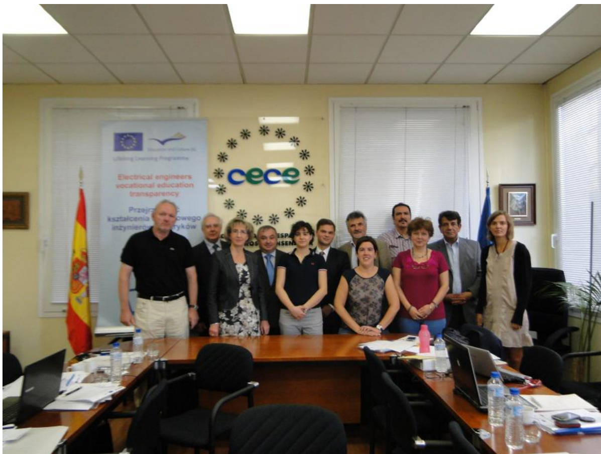
Uczestnicy spotkania Komitetu Sterującego i Komitetu Monitorującego Projektu ELEVET w Madrycie, wrzesień 2012r.