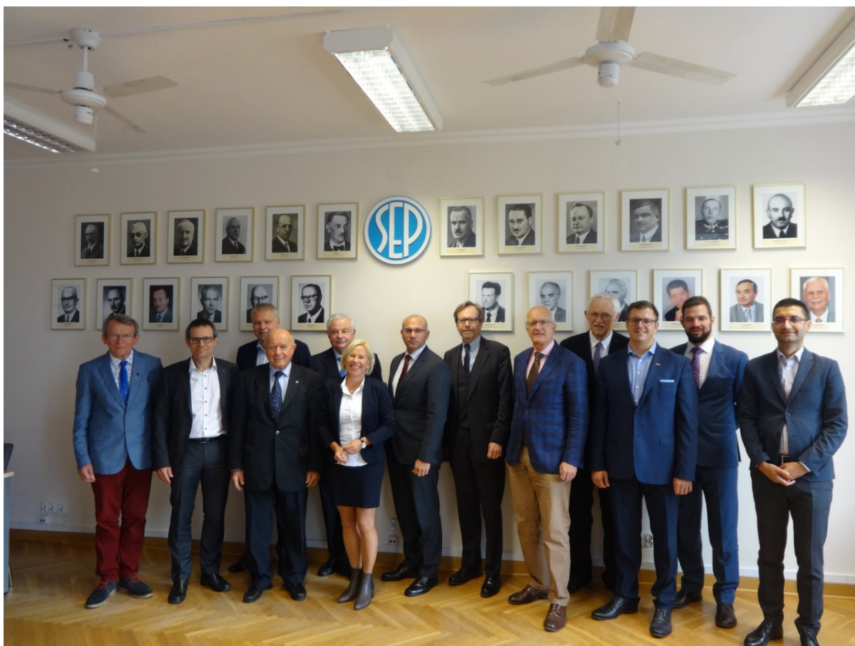
Uczestnicy EUREL General Assembly, w sali konferencyjnej