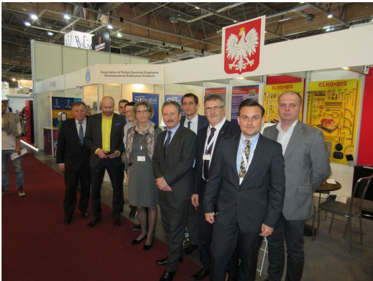
Uczestnicy wspólnego stoiska SEP i Ambasady RP w Pradze, na Targach AMPER 2017