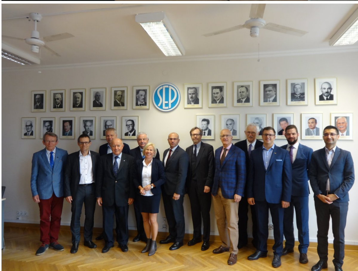
Uczestnicy EUREL General Assembly, w sali konferencyjnej