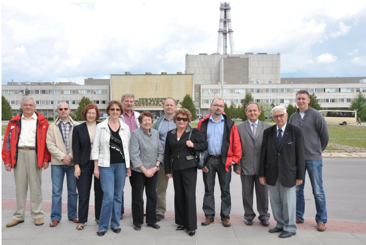
Zdjęcie na tle Elektrowni Atomowej w Ignalinie