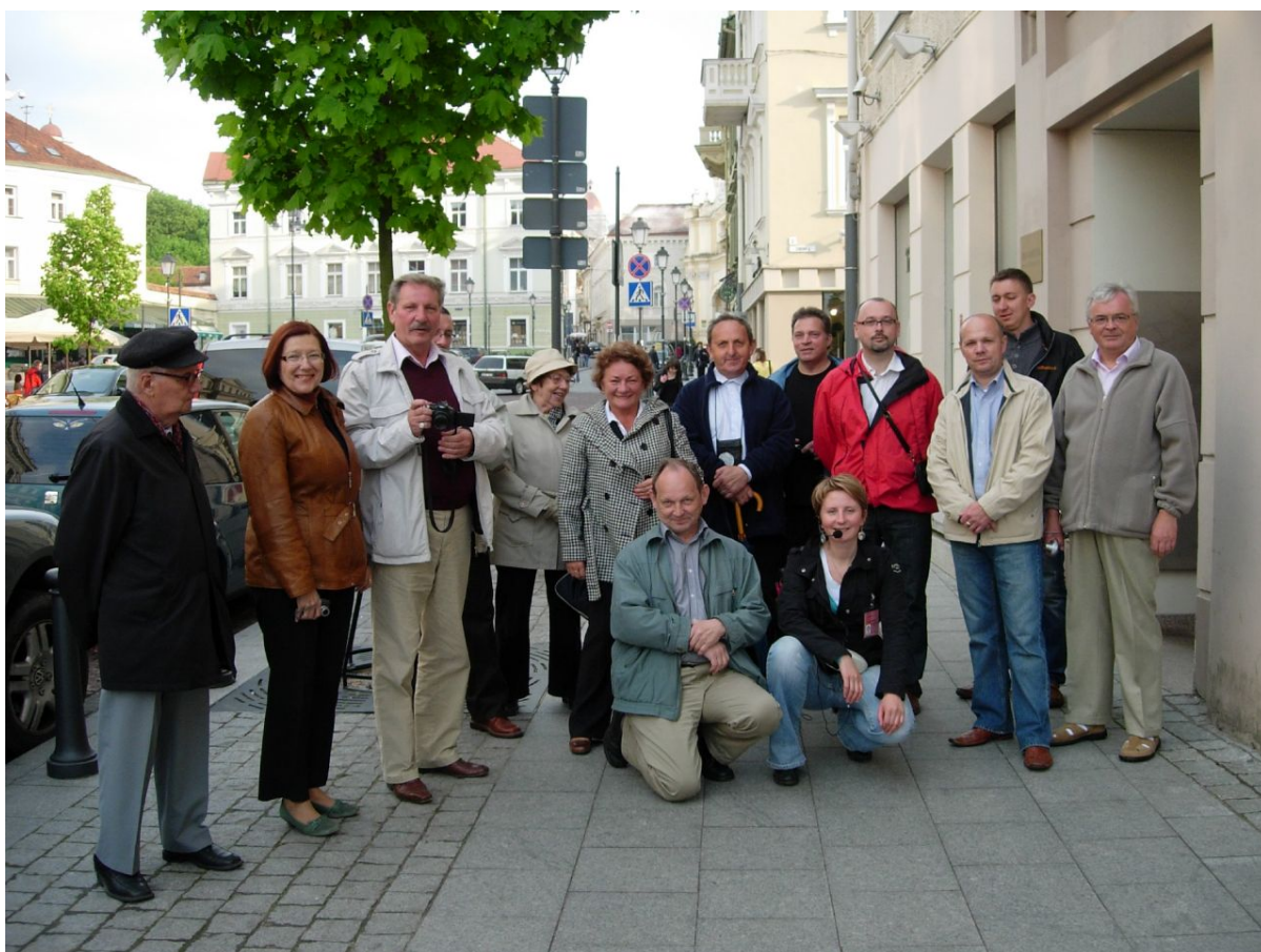
Uczestnicy wyjazdu do Wilna w 2009r.