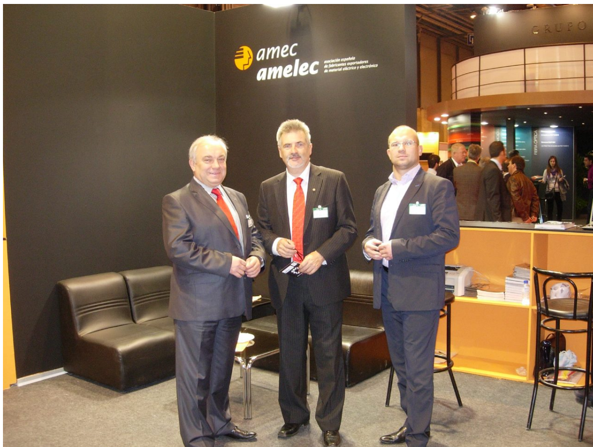
Uczestnicy wyjazdu na Targi MATELEC w 2010r.

💡 ELO SYS – Słowacja – Międzynarodowe Targi Elektrotechniki, Elektroniki, Energetyki i Telekomunikacji (ang. International Exhibition for Electrical Engineering, Power Engineering, Electronics, Lighting and Telecommunications); 2 wyjazdy w latach: 2013; 2014.