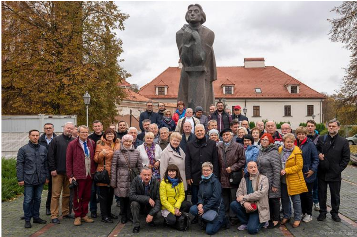
Uczestnicy sympozjum z okazji 100-lecia SEP, pod pomnikiem Adama Mickiewicza w Wilnie.

W dniach 12-15.10.2019 r. w Wilnie odbyły się jubileuszowe obchody 100-lecia SEP zorganizowane przez trzech organizatorów: Stowarzyszenie Elektryków Polskich, Polsko-Litewską Izbę Handlową, Stowarzyszenie Naukowców Polaków Litwy i Ambasadę Rzeczypospolitej Polskiej w Wilnie. Głównym celem uroczystości była prezentacja dorobku i osiągnięć elektryków polskich i litewskich w okresie 100-lecia SEP oraz osiągnięć naukowo-technicznych instytucji i stowarzyszeń działających na terenie Litwy, a także omówienie propozycji wzajemnej współpracy.