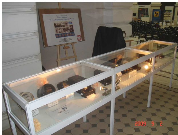
Fot.2. Wystawa historyczna. Tuż przy scenie obok sztandaru SEP umieszczona była kronika SEP.

nowacyjny), Eltrans Sp. z o.o., Koło Naukowe Fa-za Politechniki Warszawskiej, Wojskowa Akademia Techniczna, Bezpól, Atomic Energy of Canada Ltd, Wydawnictwa Naukowo-Techniczne. SEP obecny było na oddzielnych stoiskach Biura Badawczego ds. Jakości i Centralnego Ośrodka Szkolenia i Wydawnictw oraz na wydzielonym kąciku prasowym. Obok wejścia do Auli czynna była wystawa historyczna oraz prezentacje posterowe.