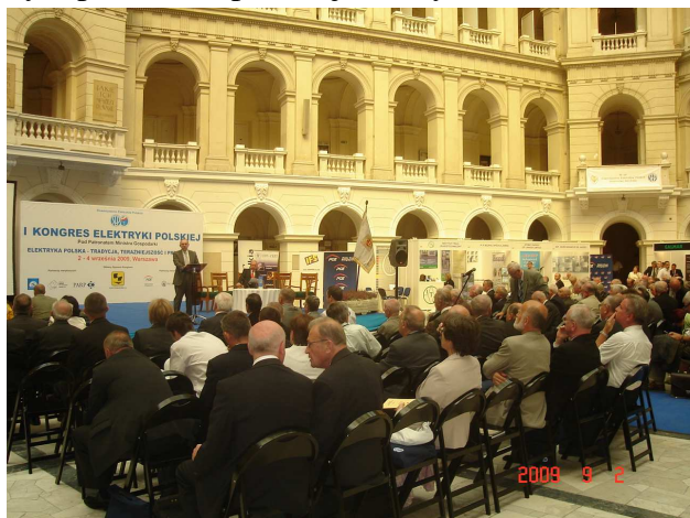
Fot.1. Sesja sponsora głównego, w głębi widać zabudowane stoiska wystawców.

Minęło już nieco ponad trzy tygodnie od zakończenia I Kongresu Elektryki Polskiej. Zwięzła relacja z trzech dni Kongresu ukazała się w poprzednich wydaniach Infosepika. Teraz pora, aby zwrócić uwagę na kwestie, które nie zmieściły się w tych relacjach lub zostały potraktowane ogólnikowo. Jedną z takich kwestii była wystawa towarzysząca Kongresowi. Na podkreślenie zasługuje fakt umieszczenia stoisk wzdłuż kruzganków Auli Głównej. Elektrobudowa (sponsor główny Kongresu) nie miała wprawdzie swego oddzielnego stoiska, ale prezentowała swe rozdzielnice w Auli Głównej, miała oddzielną sesję poświęconą efektywności energetycznej oraz stanowisko przed gmachem głównym, gdzie można było otrzymać wydawnictwo PTETiS poświęcone historycznym postaciom polskiej elektryki.