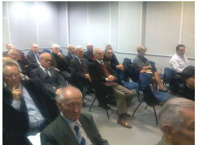
Fot. 9. Uczestnicy zebrania koła 206.