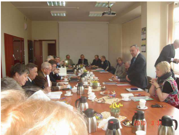
Fot. 1. Prezes SEP otwiera zebranie ZG SEP.