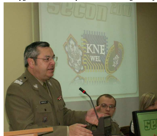
Fot. 8. prof. Zygmuntovi Mierczyk.