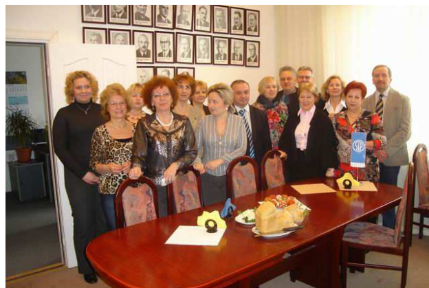
Fot. 7. Spotkanie wielkanocne w Biurze SEP.