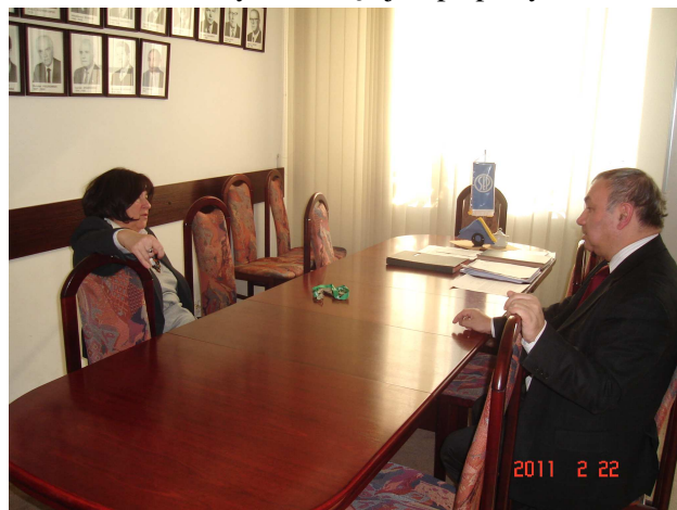
Fot. 2. Spotkanie prezesa SEP i prezesa FSNT NOT.