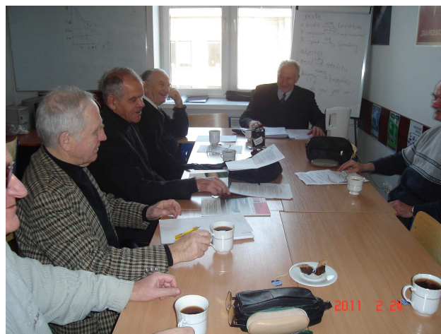
Fot. 2. Zebranie Koła Seniorów.