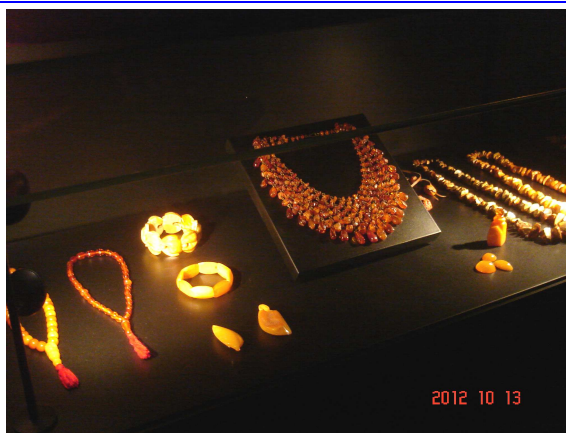
Fot. 2. Makieta zamku w Malborku. SEP-owcy rozpoczynają zwiedzanie Zamku malborskiego. Wystawa bursztynu.