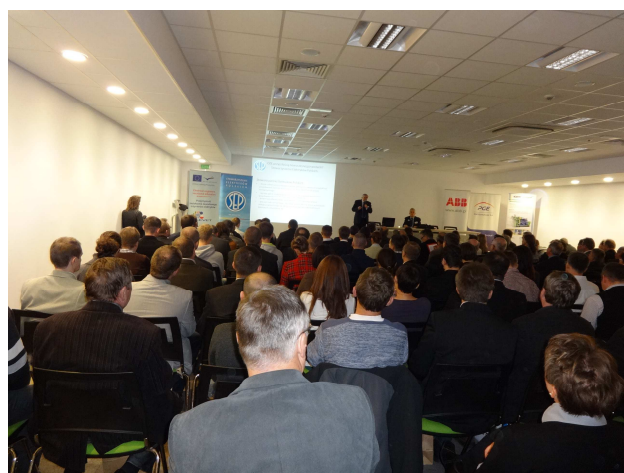
Fot. 2. Sala obrad.

Wprawdzie odpowiedź na postawione w tytule konferencji pytanie nie padła, ale zebrani byli zgodni, że podjętą tematykę należy kontynuować.