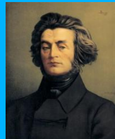
Adam Mickiewicz (1798-1855)