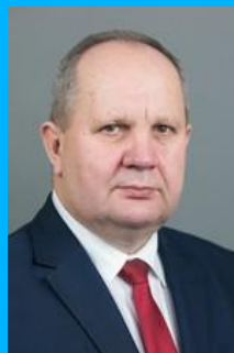
Zbigniew SOSNOWSKI Wicemarszałek