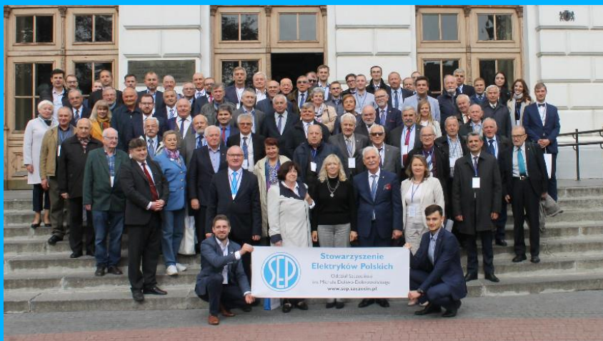
Obchody 100-lecia SEP we Lwowie (2019 r.)

Elektrycy pamiętają również o początkach działalności SEP, nawet w miejscach, które dziś są poza granicami Polski. Przykładem mogą być uroczystości 100-lecia SEP obchodzone we Lwowie na Ukrainie.