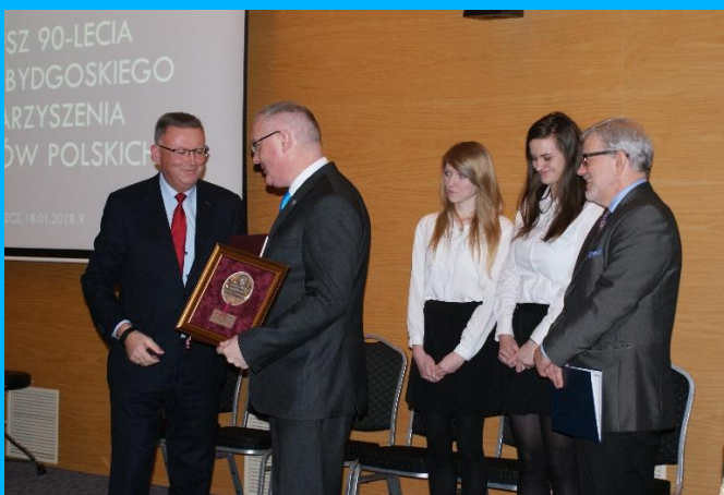
Wręczenie Medalu Marszałka Województwa Kujawsko-Pomorskiego „Unitas Durat Palatinatus Cuiaviano-Pomeraniensis” dla Oddziału Bydgoskiego SEP (2018 r.)