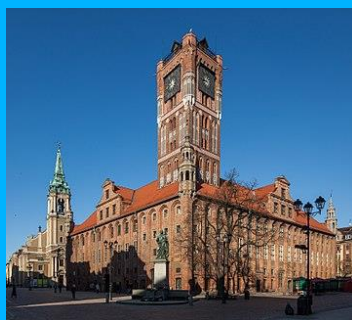
Ratusz w Toruniu https://pl.wikipedia.org/