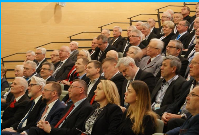
Uroczystość 90-lecia Oddziału Bydgoskiego SEP (2018 r.)