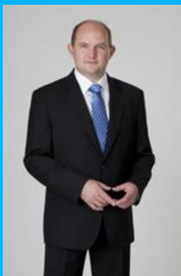
Piotr CAŁBECKI Marszałek