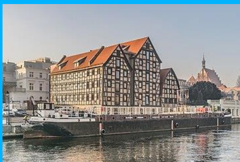
Spichrze nad Brdą w Bydgoszczy https://pl.wikipedia.org/