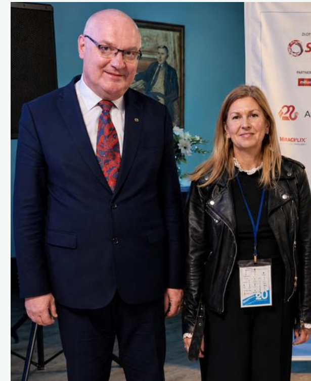
z posłanką na Sejm RP Iwoną Arent