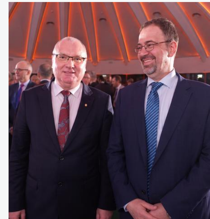
z noblistą Daronem Acemoğlu