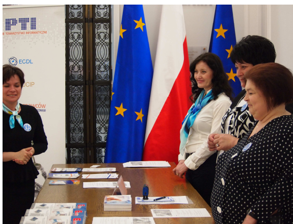
Oprac. Iwona Fabjańczyk, Dział Organizacyjny Biura SEP