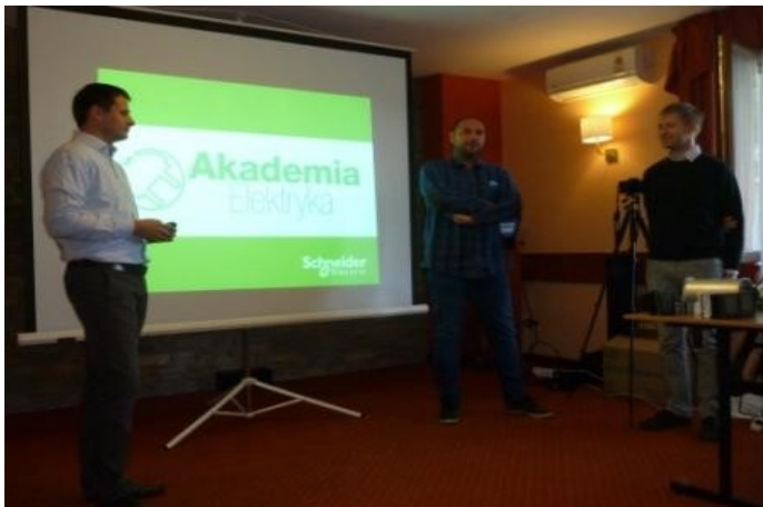
Fot. 5 - w czasie seminarium