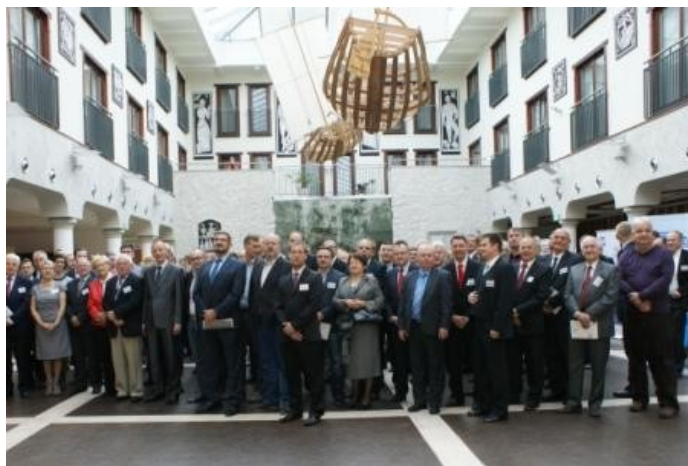
Fot. 7- uczestnicy konferencji