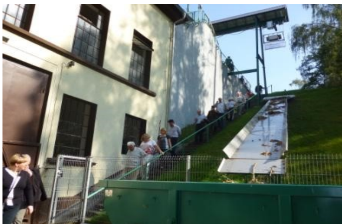
Fot. 2 - uczestnicy warsztatów

logii dla środowiska naturalnego”. Poszczególne stowarzyszenia miały wyznaczone zadania związane z realizacją tego tematu, w ramach których przeprowadzono warsztaty, związane głównie z ochroną środowiska. Stowarzyszenie Elektryków Polskich odpowiedzialne było za część warsztatów, związaną ze zwiedzaniem elektrowni wodnych. Koledzy z SEP załatwiali wszystkie formalności związane z pozwoleniem na zwiedzanie elektrowni w Gałąźni Małej, Strzegominie i Krzyni. Stanowili też liczną grupę uczestników żywo zainteresowanych technicznymi rozwiązaniami ponad 100-letnich elektrowni. Osobą, która omówiła zasadę pracy poszczególnych elektrowni, oprowadzającą i wyjaśniającą był specjalista w tej dziedzinie kol. Henryk Niezgoda, wieloletni pracownik i dyrektor elektrowni wodnych. Wszyscy uczestnicy bez wyjątku wykazywali duże zainteresowanie tym tematem. Atrakcyjnym punktem warsztatów były występy Kol. inż. budownictwa Anny Pożlewicz, wielokrotnej laureatki nagród za wykonanie poezji śpiewanej, a wieczorem odbyła się biesiada i biesiadne śpiewanie przy dźwiękach akordeonu. Warsztaty zorganizowane były w malowniczym terenie nad jeziorem Krzynia, w Krajobrazowym Parku Dolina Słupi, co stworzyło fantastyczne warunki do wypoczynku.