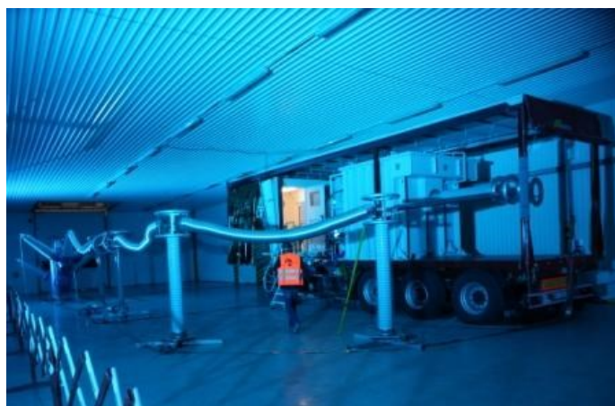
Fot. 5 – miejsce próby z wykorzystaniem systemu pomiarowego trzeciej generacji DAC MV20 60 kV