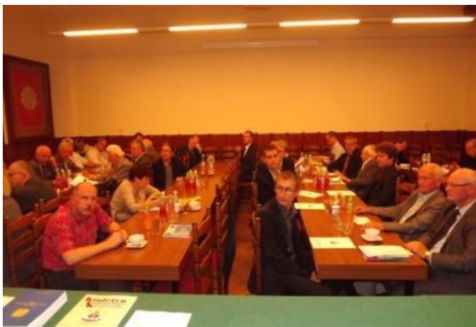
Fot. 3 – sala obrad