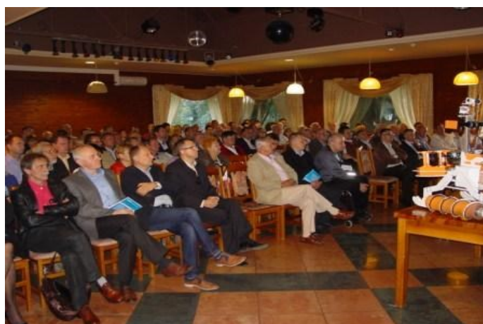
Fot. 1—uczestnicy spotkania w trakcie seminarium

opuszczali gościny ośrodek „Bobrowa Dolina”. W trakcie spotkania kolportowano także najnowszy 41 numer oddziałowego Biuletynu.