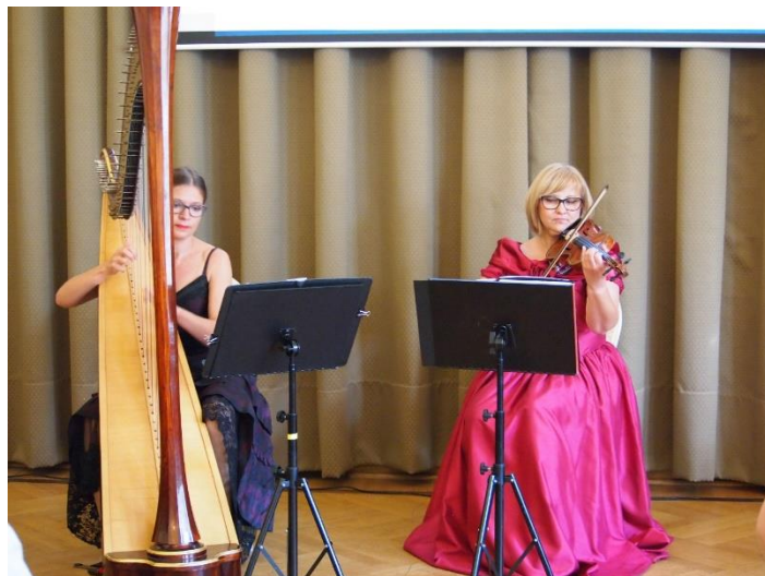
Fot. 3. Koncerty zespołu kameralnego.