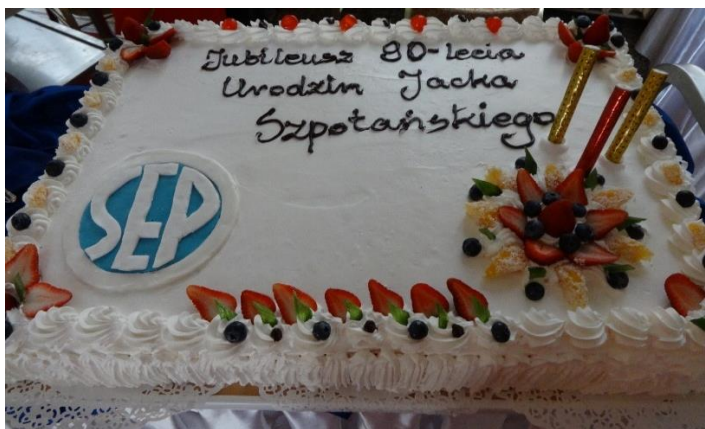
Fot. 5. Tort urodzinowy.

Prezes SEP Piotr Szymczak wznosił toast na cześć Jubilata lampką wina, po toaście na salę wjechał tort urodzinowy dla kol. Jacka Szpotańskiego.