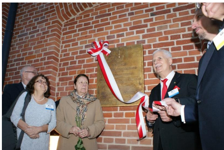
Fot. 12. Odsłonięcie tablicy pamiątkowej.