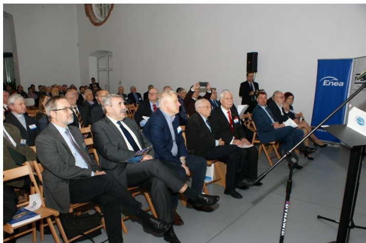
Fot. 11. Uczestnicy na sali obrad.