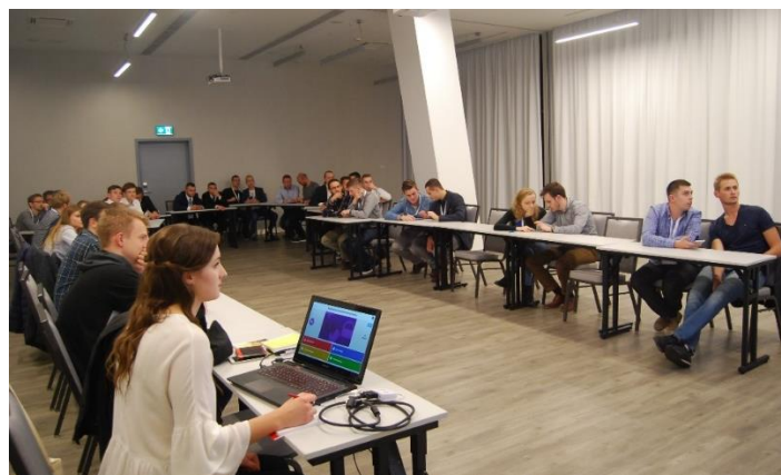
Fot. 6. Podczas quizu z zakresu wiedzy elektrycznej w ramach Ligi Elektryków.

frekwencją uczestników. Popołudniu w laboratoriach na Wydziale Elektrycznym Politechniki Białostockiej oraz na hali Akademickiego Centrum Sportu odbyła się sesja praktyczna współzawodnictwa w ramach Ligi Elektryków.