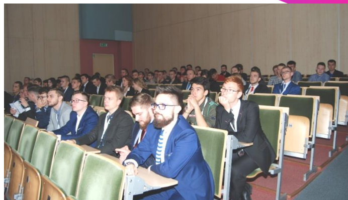
Fot. 1. Uczestnicy XIX ODME 2017 podczas inauguracji.

Po 18 latach Ogólnopolskie Dni Młodego Elektryka ponownie zawiąły do Białegostoku. Była to już 19. edycja tej imprezy, która odbyła się w dniach 26-28 października 2017 r. Uczestniczyło w niej 20 delegacji młodych elektryków z uczelni i szkół z całego kraju.