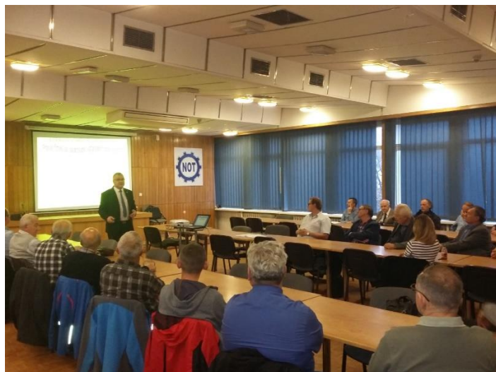
Fot. 13. Inauguracyjny referat Klubu CzE.

30 listopada 2017 r. i będzie dotyczyć zarysu historii przemysłu elektrotechnicznego w Polsce.